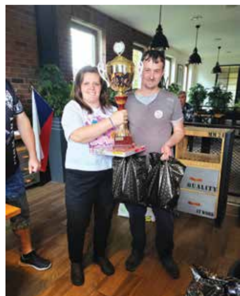
Vítězný tým MIMA.