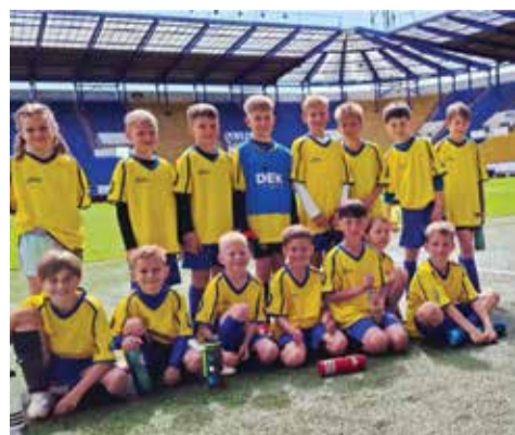
Stříbrný tým ZŠ R. Koblíce.