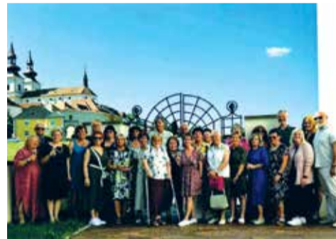
Absolventi zatím posledního dvouletého cyklu U3V.

V letošním roce ukončilo studium 36 posluchačů, kteří v úterý 26. května převzali v kostele Stětí sv. Jana Křtitele závěrečná osvědčení o absolvování a pamětní listy. „Velmi nás těší veliký zájem posluchačů o přednášky a zároveň mrzí to, že máme omezenou kapacitu, a tak nemůžeme jejich počet rozšiřovat.“