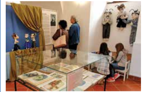
Výstava knih a loutek na kadaňském hradě připomíná 150. výročí prvního vydání Broučku Jana Karafiáta a 180. výročí autorova narození. J. Hub

Vykližení domů, bytů, chat. Tel.: 601 521 459