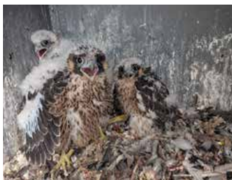
Tušimickým trojčatům se kroužkování moc nelíbilo. Nebylo ani divu, na rozdíl od ostatních mláďat už byla trochu odrostlejší.

Sečteno, podtrženo a okroužkováno; sokolí budky umístěné na výškových stavbách Skupiny ČEZ tak může opustit 22 letošních sokolů. Z 12 hnízdících párů jich v tomto roce bylo úspěšných sedm, a to hned třikrát se čtyřčaty. Takzvaná Sokolí farma Skupiny ČEZ zahrnuje 12 lokalit, a to Dětmarovice, Dukovany, Ledvice, Mělník, Počeradý, Poříčín, Proboštov, Prunéřov, Temelín, Třeboradice, Tušimice a Trmice.