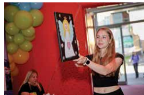
Jedno z vydražených děl.