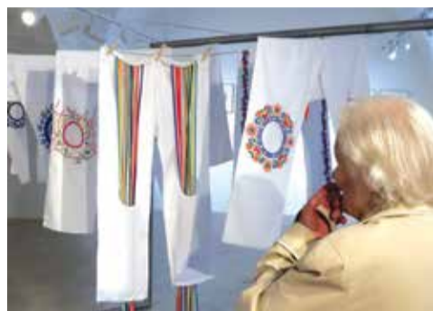
Proč jsou tam díry?

Výstavu Poslední zhasne máte možnost vidět v kadaňské Galerii Josefa Lieblera až do 21. června a rozhodně byste ji neměli minout. Vřele doporučujeme podívat se do prospektu, jinak hrozí, že uvidíte jen děravé ubrusy, ubrousky a kalhoty. M. Šil