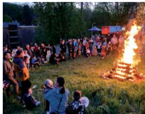
Hranice plála vysokým plamenem a všem bylo dobře.

Příjemný podvečer zakončilo zapálení hranice, opékání buřtů a pěkná hudba kapely Muzika občas a letos poprvé i májka tyčící se nad všemi. M. Šil