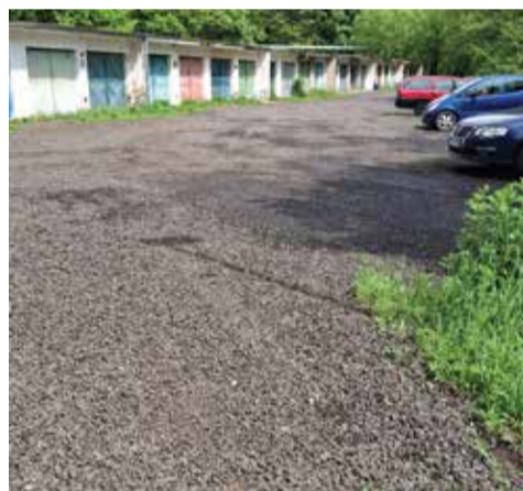
Cesta ke garážím, o kterou jde.

Zároveň jsem se ptal i na možnost využití materiálu z oprav na Chomutovské ulici. Tamní recyklát ale podle odboru výstavby obsahoval i hrubé frakce kameniva ze spodních vrstev, takže by při