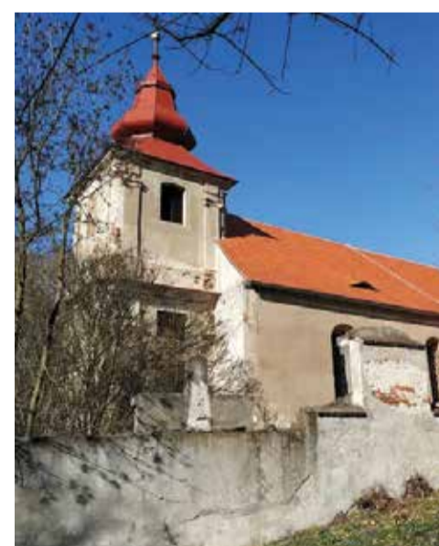
Kostel sv. Mikuláše.

15:00–15:05 – Otevření kostela 16:00–16:15 – Proslov (současnost a budoucnost kostela) 17:00–18:00 – koncert ZUŠ 19:00–19:30 – Film Mikulovice (GSOŠ Klášterec nad Ohří)