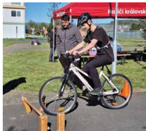
Součástí soutěže byla i jízda zručnosti. Zabrzdít před špalíky bylo pro většinu jezdců velmi těžké. Foto M. Šil

Soutěž probíhala ve dvou věkových kategoriích. Pro děti od 10 do 12 let a pak od 12 do 16 let. M. Šil