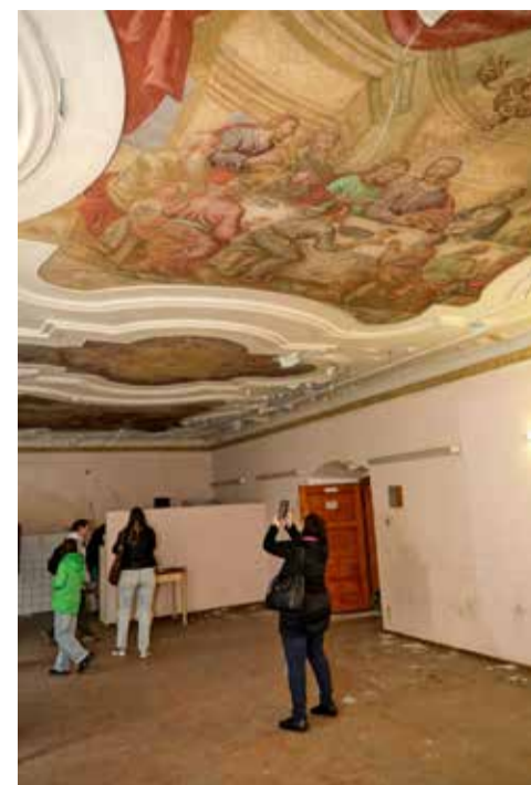
Refektář (jídlna) kláštera je vyzdobena malbami od stejného autora jako například kostel Stětí sv. Jana Křtitele - Josefa Fuchse.

Klášteří kostel bývá tradičně přístupný při bohoslužbách. M. Šil