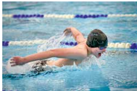
Kadaňský pohár.

Lokální kryté koupaliště hostilo v sobotu 18. dubna tradiční Kadaňský pohár, který přilákal více než 150 plavců z 11 klubů. Domácí reprezentanti se v silné konkurenci rozhodně neztratili a vybojovali řadu medailových umístění.