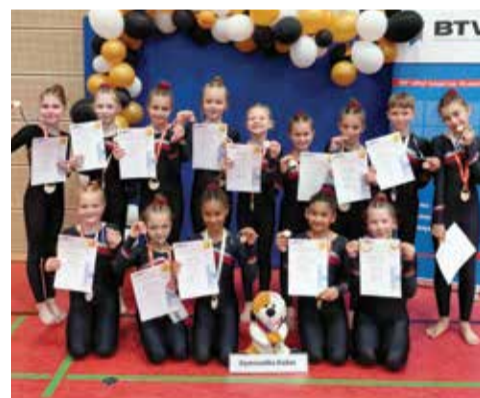
Zlatý kadaňský tým.