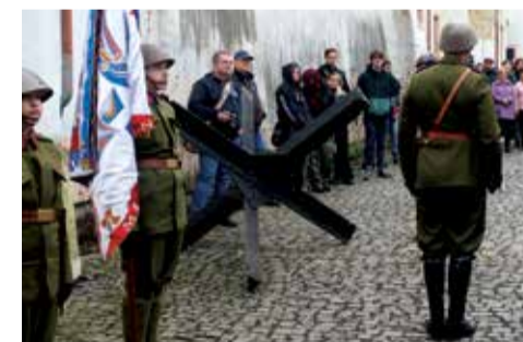
Mezi vojáky protitankový ježek.