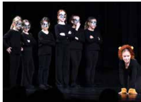
Stejně jeden jako druhý byly nudné. Když se ale vybarvily podle svých představ a tužeb, najednou hýřily barvami a dobrodružstvím.