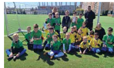
Vítězné týmy se svými trenéry.