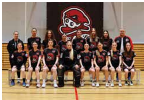
Vítězný tým žen Black. Foto