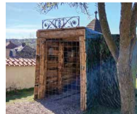
Model štoly v zahradě.

Upozorňujeme dárce, že z provozních důvodů bude omezen provoz Transfúzního odběrového centra v Žatci. S platností od 4. 5. 2026 je centrum pro dárce krve otevřeno pouze ve čtvrtek od 6.30 do 8.30 hodin.