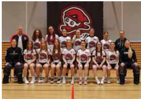
Vítězný tým juniorek. Foto