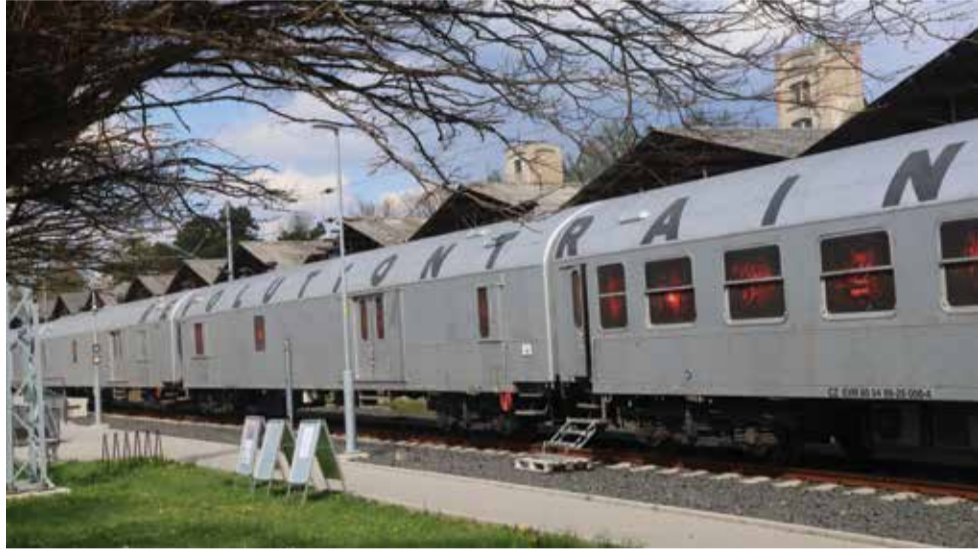
Revolution Train stál a vital zájemce celý den.

Po bouřlivé diskusi v zastupitelstvu, kterou vzbudil plán radnice na podporu preventivní protidrogové akce Revolution Train, se tolik probíraný vlak objevil ve stanici Kadaň předměstí. V úterý 21. dubna do něj celý den proudily davy lidí. A to bez nadsázky. Podle vyjádření jeho provozovatelů bylo velmi složité uspokojit zájem škol a rovněž po 15. hodině odpolední, kdy přišel čas pro veřejnost, se množství návštěvníků nezmenšilo. Je to přinejmenším důkaz opravdového zájmu o tuto formu prevence a toho, že šlo o krok správným směrem. M. Šil